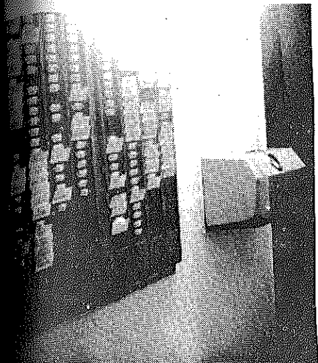
Mise en sommeil. A l'heure électronique le contrôle humanisé conserve toute sa valeur.

. Le Chef de Bataillon VOLATIER assure depuis le 7.2. les fonctions d'officier divisionnaire de reclassement au C.D.A. de Marseille. Tél : 52 69 25 Poste 28 19.