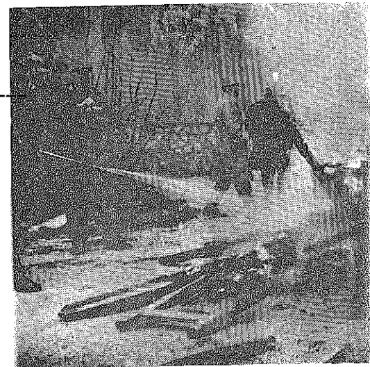
Un exercice d'incendie qui a rendu service à l'A/C CHENUAU.