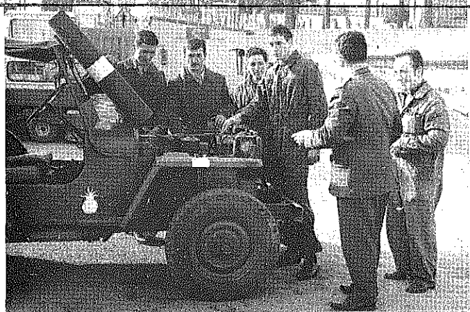
Allez y franchement elle en a vu d'autres

au garage. Aussi quand vous faites vos demandes de véhicules au G.E.M, pensez un peu à eux. Très souvent les sorties pourraient être groupées, cela économiserait matériel, absence, fatigue et par conséquent même réduirait les risques d'accident.