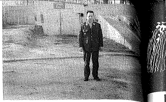
Alignés pour les besoins de la cause