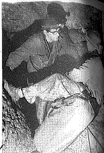
GROS AVEN - Au sommet du puits de la baignoire (- 80 m. RICHIER - MICHAUD)

GROS AVEN - La Galerie Gothique (- 250 m.)