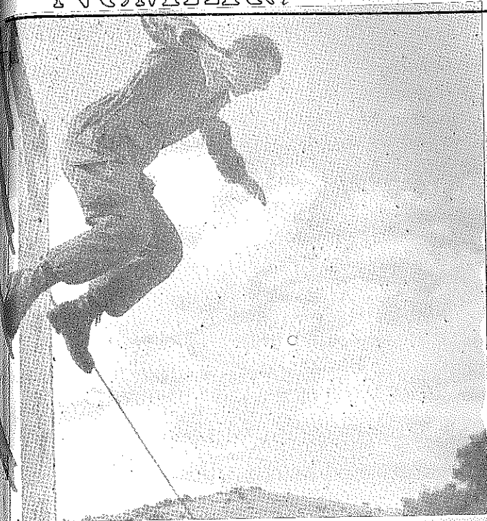
Les "Engagés" à Carpiagne - Parcours du combattant (franchissement d'un obstacle)...