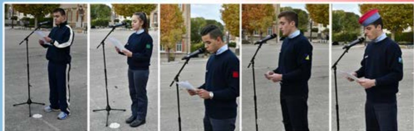
Prises de paroles d'élèves de chaque compagnie pour commémorer l'armistice. Vendredi 9 novembre