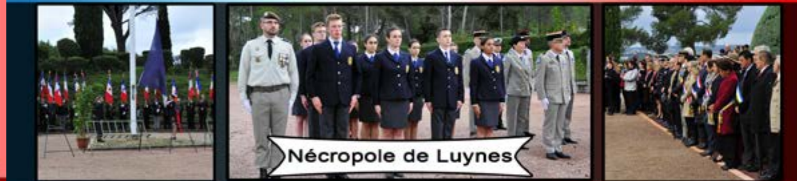
Nécropole de Luynes