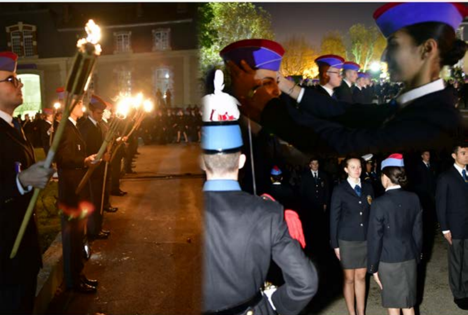
Remise des calots aux élèves de 1 ère année des classes préparatoires par leur parrain ou marraine de 2 ème année.