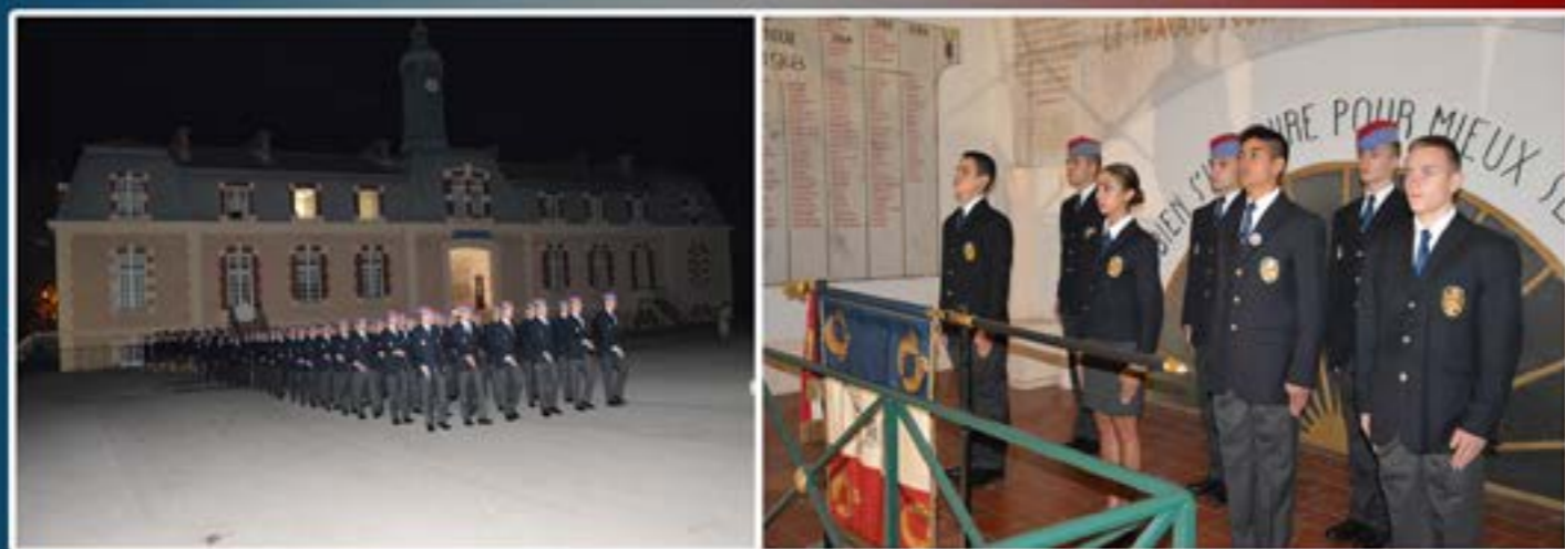
La cérémonie s'est déroulée dans la nuit, sur la place d'armes ainsi que dans le hall d'honneur du bâtiment Marne. Les élèves de la 2 ème compagnie étaient accompagnés de leur parrain ou marraine de la 1 ère compagnie.